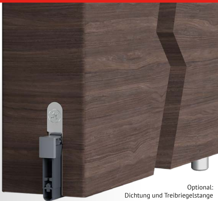
Optional: Dichtung und Treibriegelstange nebeneinander